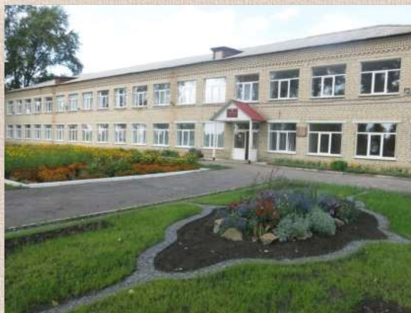
МОБУ «Рождественская СОШ», 2017 г.