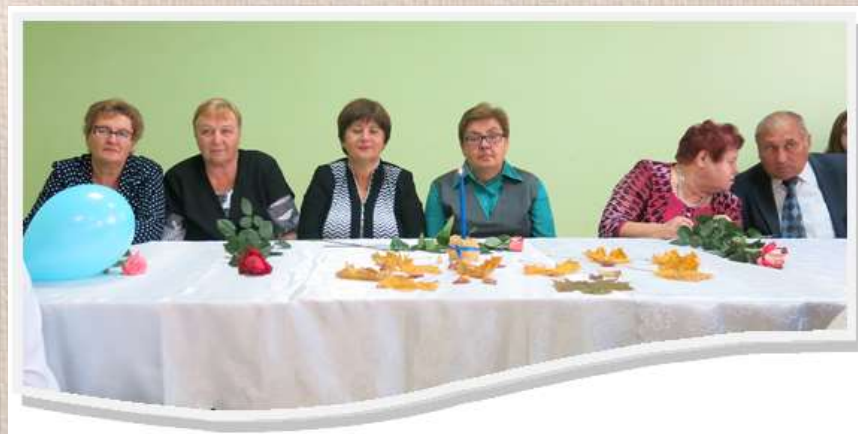
«Встреча ветеранов педагогического труда»