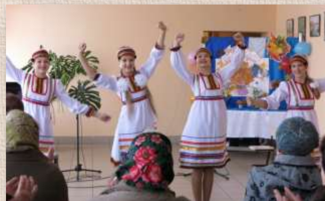
«Вечер встречи с тружениками тыла»