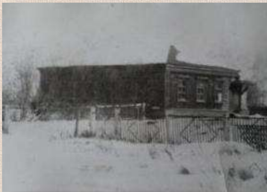
Рождественская начальная школа, 1909 г.

С памяти, с уважения к прошлому, со школьного порога начинается Родина. И пока раздаются ребячьи голоса в этих стенах, пока звенит школьный звонок, не будет в истории последней страницы.